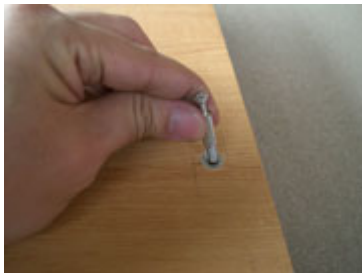
Masukan baut ke empat sisi yang sudah disediakan