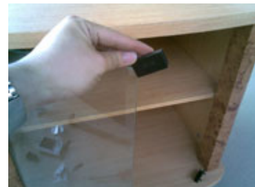
Letakan besi di ujung meja