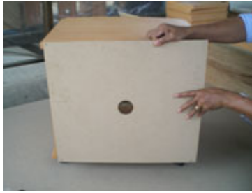
Posisikan triplek dibelakang meja