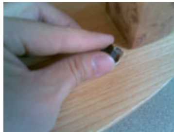
Masukan sparepart tersebut di lubang disamping tiang