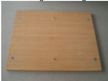
Kayu dinding meja setelah scrup bulat dimasukkan di 4 sisinya