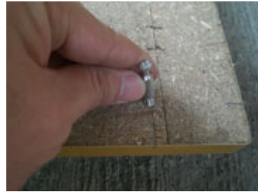
Masukan baut ke 4 sisi lubang yang sudah dibuat