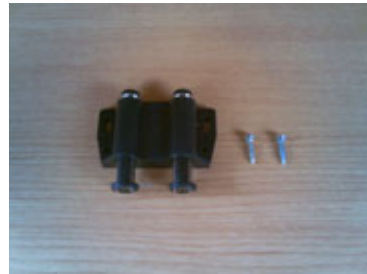
Alat magnet kaca