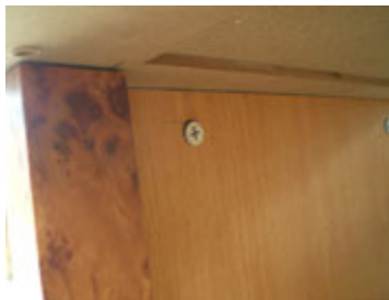
Putar scrup supaya terkunci