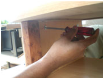
Dengan obeng, putar scrup bulat di dinding meja supaya terkunci dengan kayu bagian atas