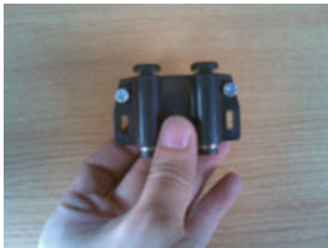
Masukan baut ke lubang di magnet