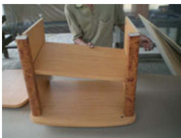
Posisikan rak meja di penyangga rak yang telah dipasang