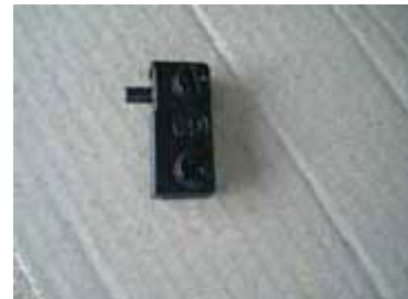
Part penyangga meja