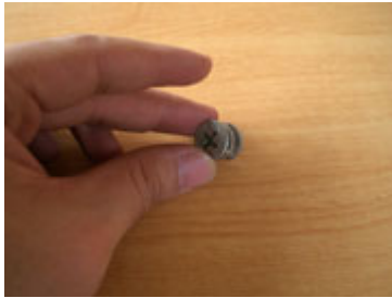
Bentuk scrup bulat untuk mengunci dinding