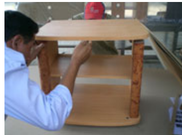
Posisikan diatas meja