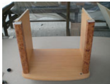
Bentuk dinding dan kayu bawah setelah dipasang