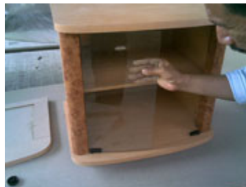
Posisikan kaca supaya dapat masuk ke penyangga kaca dan kencangkan penyangga kaca dengan obeng