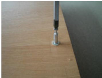
Putar dengan obeng