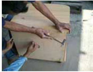
Ketukan dengan palu supaya triplek dapat terpasang di bagian belakang meja