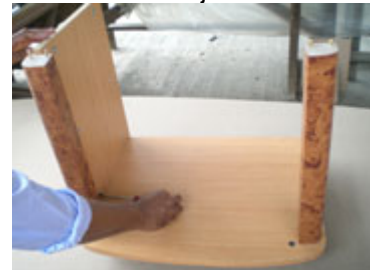
Dengan obeng, putar scrup bulat supaya terkunci dengan bor yang ada di kayu bawah