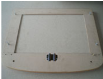
Putar baut dengan obeng di bagian tengah di lubang yang telah disediakan