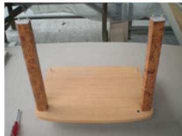
Tiang setelah dipasang