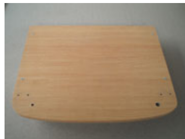
Bentuk kayu bawah