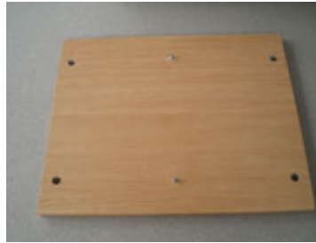
Bentuk dinding meja