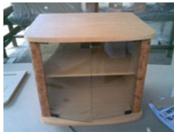
Bentuk meja yang sudah selesai