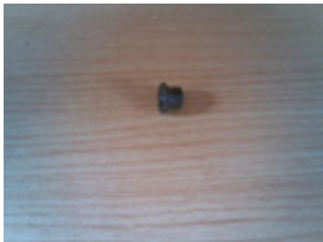
Sparepart plastik bulat