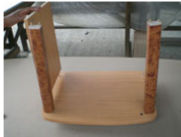
Posisikan dinding meja ke kayu bagian bawah. Bor di kayu bawah agar dimasukkan ke lubang di dinding meja