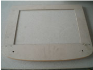
Kayu lapisan paling atas