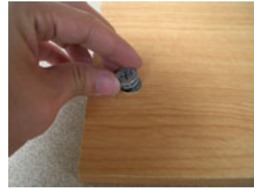
Masukan scrup ke dinding meja