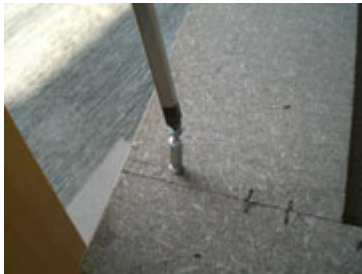
Putar bautnya dengan obeng