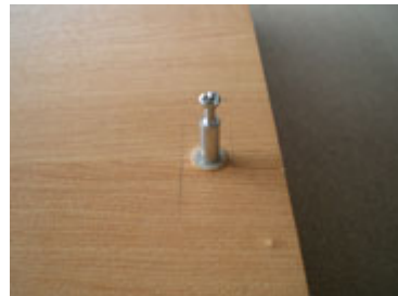
Bentuk baut setelah dipasang