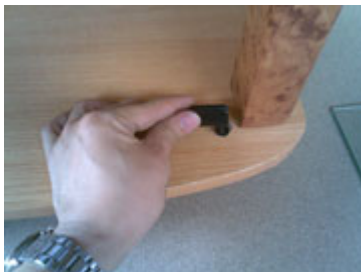
Masukan part penyangga kaca ke lubang sparepart disamping tiang