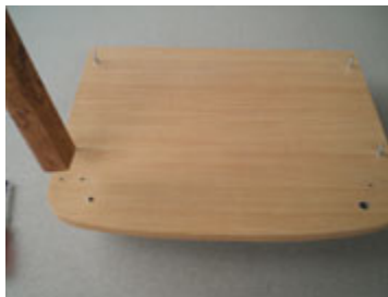
Tancapkan tiang ke lubang seperti di gambar