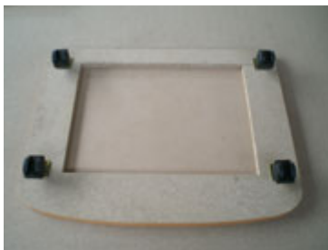
Kayu paling bawah, roda sudah dipasang