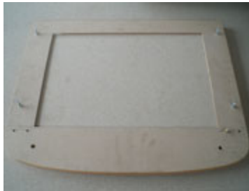
Bentuk setelah baut dipasang