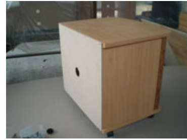
Bentuk setelah triplek bagian belakang terpasang